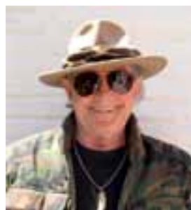
POR CARLOS REBELLA

A medida que aparecen en nuestro país cornamentas de ciervo colorado con características típicas y puntajes a nivel internacional, comienzan a desaparecer los detractores de las estaciones de cría, verdaderas usinas de reproductores que en menos de dos décadas han empezado a revertir la decadencia inocultable de nuestros trofeos nativos. El injusto mote de ciervos de corral con que se pretendió denostar a los que nacieron en cautiverio, pone en evidencia la incultura global de quienes por error u omisión ignoran que los padrillos foráneos procrean innumerables descendientes que, más temprano que tarde, se incorporan al patrimonio faunístico de nuestro país. Importar colorados, muflones, carneros, ibex, dama, etc. de Oriente o Europa demanda inversiones extraordinarias y lógicamente deben ser protegidos por cercados y vigilados de igual forma que los toros de pedigree, los carneros de cría o los caballos de raza que se exhiben y venden en decenas de asociaciones rurales que velan por su estándar.