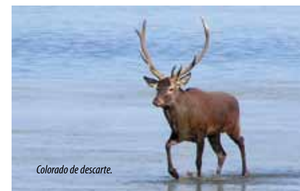
Colorado de descarte.

Y como vale más una imagen que mil palabras, Vida Salvaje exhibe nuevamente una cornamenta