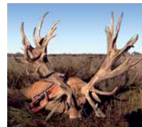
Colorado récord sudamericano.

Por otra parte, no existe otro sistema para conceptualizar especies deportivas que la medición del trofeo según las fórmulas internacionales. Partiendo de esa premisa, sostener que la caza en campos abiertos resulta el non plus ultra venatorio es negar la evidencia: la gran mayoría de las capturas de las últimas décadas no resisten a la matemática